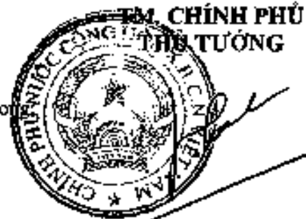
Nguyễn Xuân Phúc